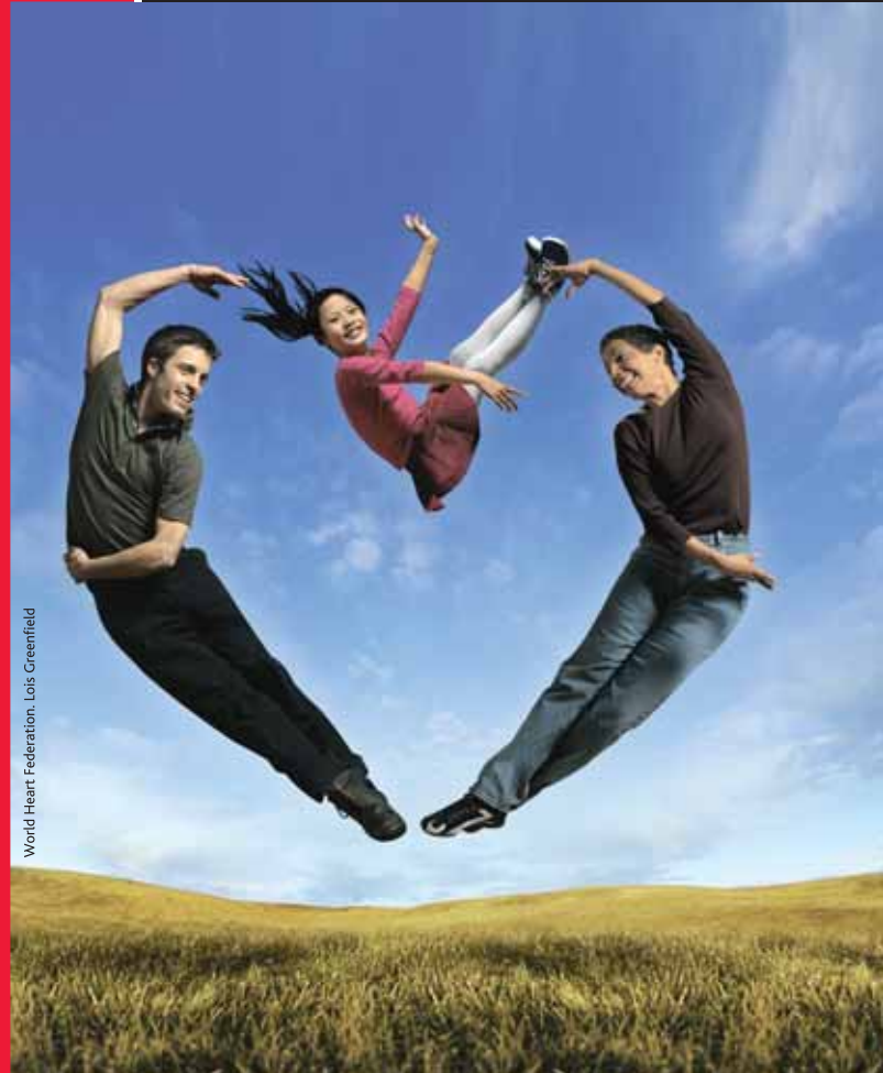
World Heart Federation. Lois Greenfield

24 Setembro 2006 | Domingo Praia de Sto. Amaro de Oeiras